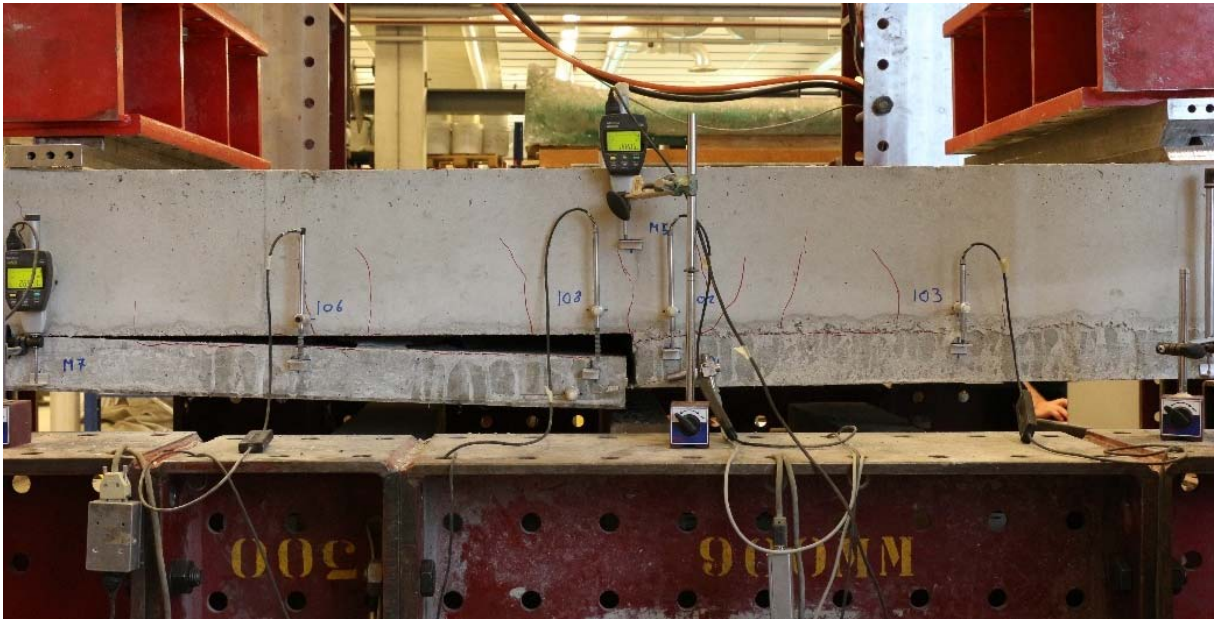
foto 1 Bezijken door het door het onthechten van het aansluitvlak